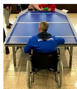
Fig. 6 - Mesa de Polybat