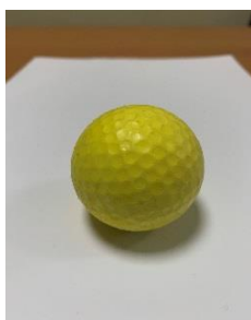
Fig. 3 - Bola de Polybat

2. Na Divisão 2 o comprimento da linha final fica reduzido 10 cm em cada lado (linha final com 1,00 m, em vez de 1,20 m).