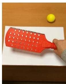
Fig. 5 - Bastão e Bola