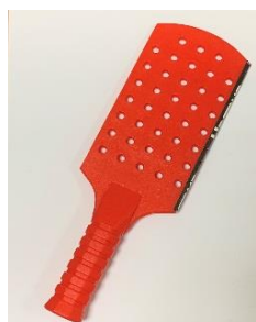
Fig. 4 - Bastão de Polybat